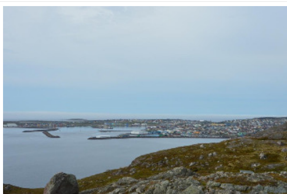
Ville de Saint Pierre, ©Pascal Le Floch

Des travaux récents décrivent la trajectoire de croissance de l'archipel de Saint-Pierre et Miquelon depuis la fin de l'exploitation industrielle de la morue en 1992.