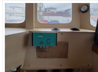
Dispositif installé dans la cabine

Lancé en octobre 2021, le projet PIFIL, porté par le CNPMM, vise à acquérir des données en mer pour la validation scientifique d'une solution technologique efficace et éprouvée sur le terrain. Le programme s'inscrit dans la lignée des projets de recherche menés par les professionnels de la pêche et les scientifiques. En capitalisant sur les expérimentations du projet LICADO initié en 2019, PIFIL s'intéresse à un dispositif prometteur pour les fileyeurs : l'activation durant l'opération de filage de répulsifs acoustiques de nouvelle génération, conçus spécifiquement pour les dauphins communs (les pingers CETASAVR). Les résultats obtenus dans le cadre de LICADO sont encourageants mais une expérimentation à plus grande échelle est nécessaire pour pouvoir ensuite évaluer son efficacité sur la base de données statistiques robustes : c'est l'objectif du projet PIFIL.